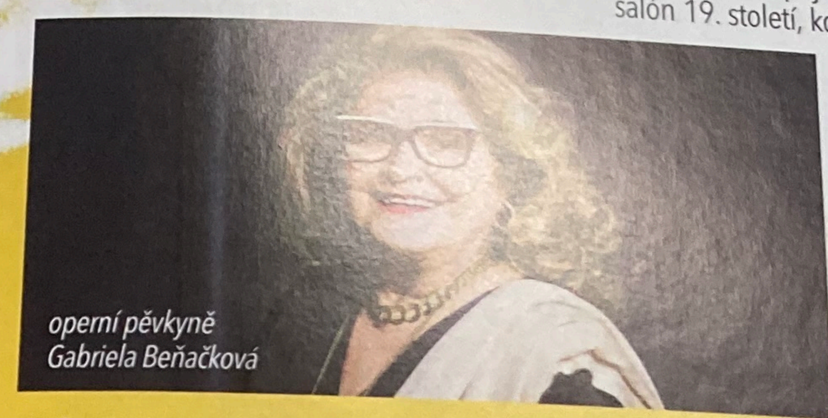
operní pěvkyně Gabriela Beňačková

akce - Václav Hudeček oslaví 70, Gabriela Beňačková 75, Štěpán Rak 77 a Jirka Stivín 80.